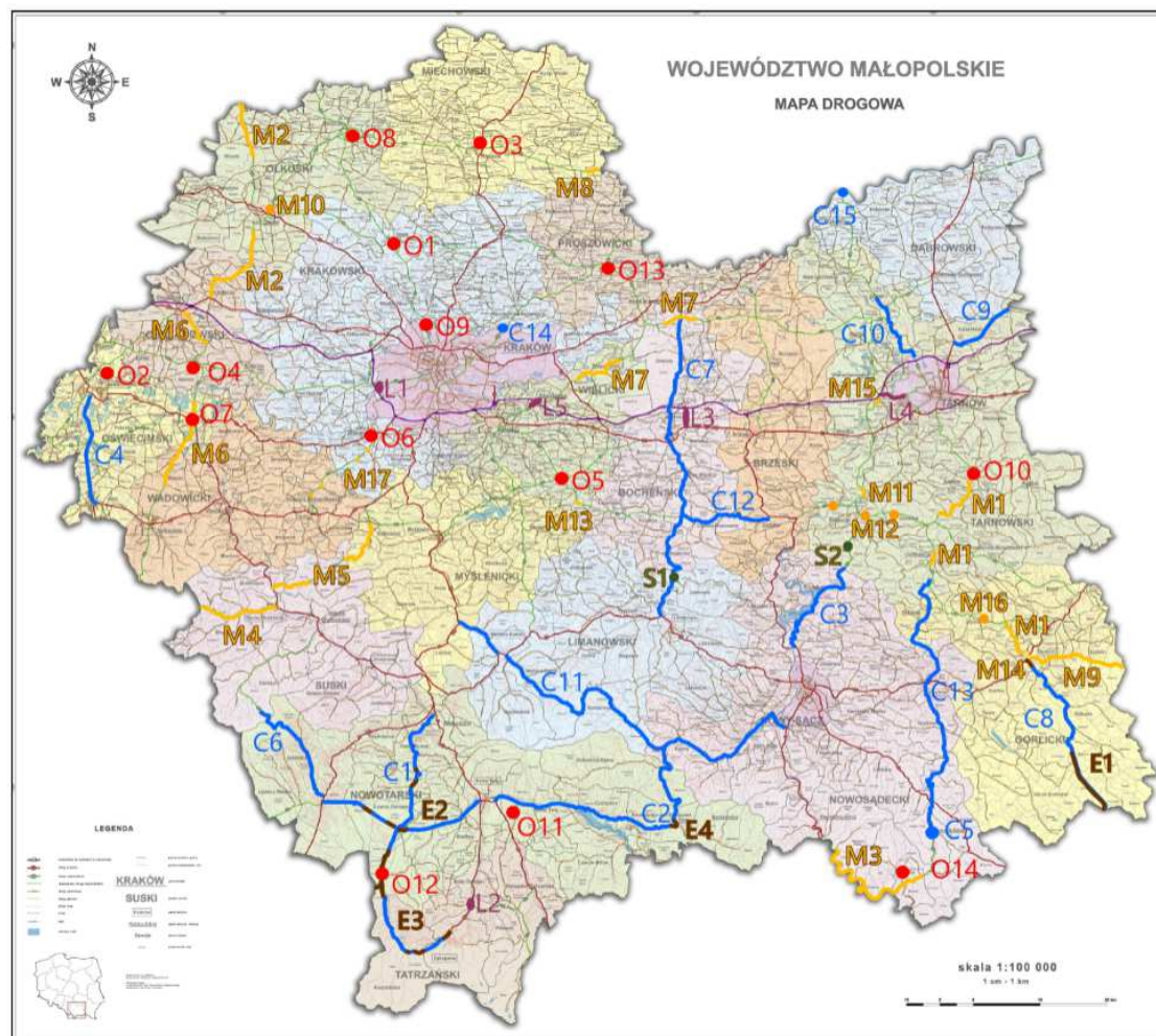
Rys. 2. Planowane inwestycje drogowe w Małopolsce do roku 2023